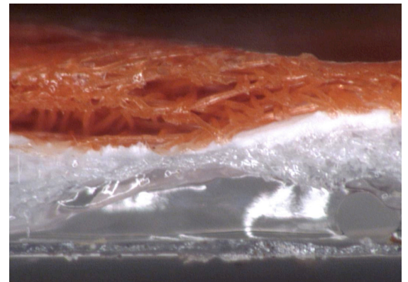
WrapShield SA Auto Adhesivo es una lámina formada por tres capas de polipropileno micro poroso laminadas con un adhesivo acrílico patentado permeable al vapor.