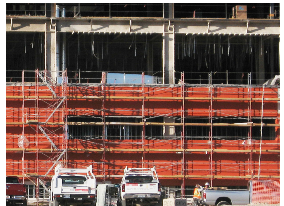
Administración de Veteranos Hospital Principal, Las Vegas Norte, NV; 300,000 piés cuadrados de WrapShield SA Auto Adhesivo en combinación con revestimiento exterior de Tresa, metal y ladrillos.