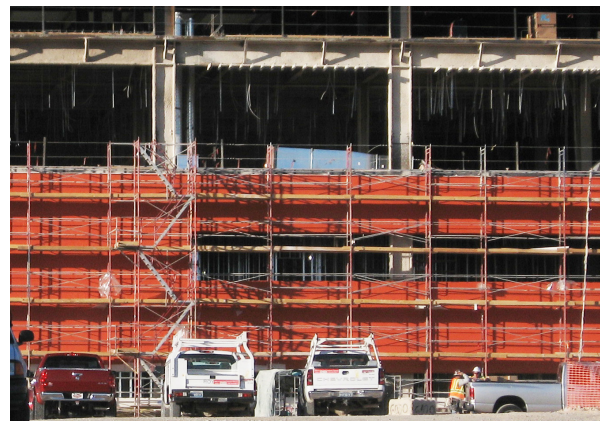
Veteran's Administration Main Hospital, North Las Vegas, NV 37,161 m 2 de WrapShield SA Autoadhésif avec revêtement extérieur de brique et de métal Trespa.