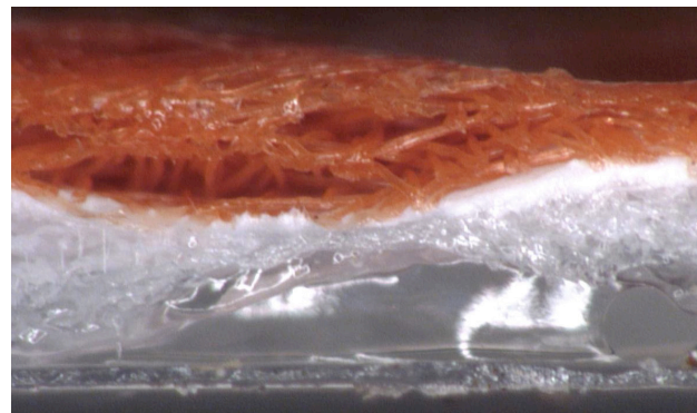
WrapShield SA Autoadhésif est un film stratifié de polypropylène microporeux à 3 couches avec adhésif acrylique propriétaire perméable à la vapeur